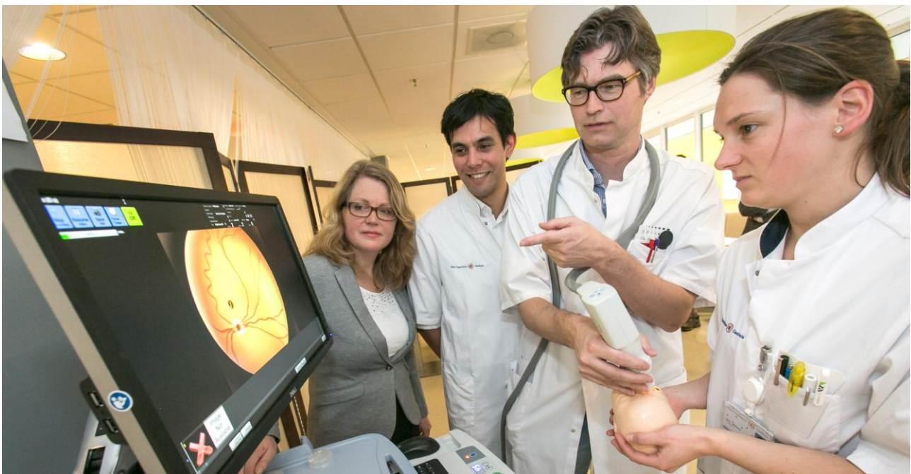
RetCam netoliescamera, geschonken door het Oogfonds