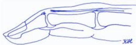
Mallet finger met peesletsel